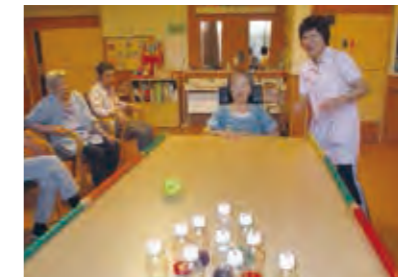
レクリエーション (ボーリング)