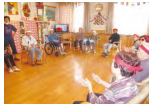
レクリエーション (運動会)