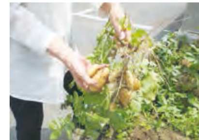
園芸活動 (じゃがいも掘り)