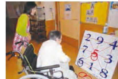
レクリエーション (輪投げ)