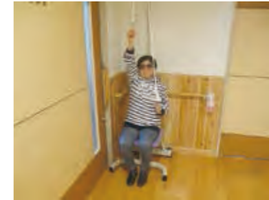
機能訓練風景 (プーリー)