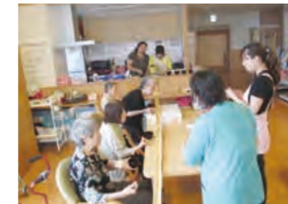
レクリエーション (流しそうめん)