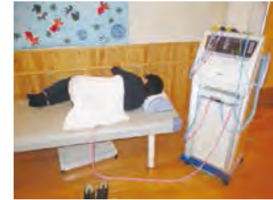
機能訓練風景 (低周波)